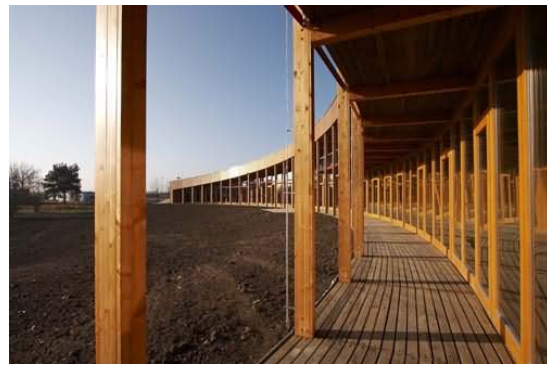
Fotografie ekologického centra Sluňákov.